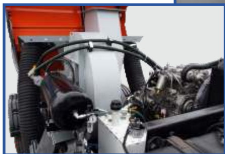
Sucção / Succión / Suction