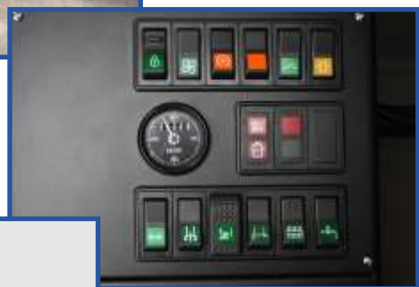
Comandos / Comandos / Controls