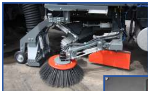
Varrição / Barrido / Sweeping